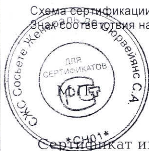
Схема сертификации № За. Продукция маркируется знаком соответствия по ГОСТ Р 50460-92. Знак соответствия наносится на упаковке и сопроводительной документации.